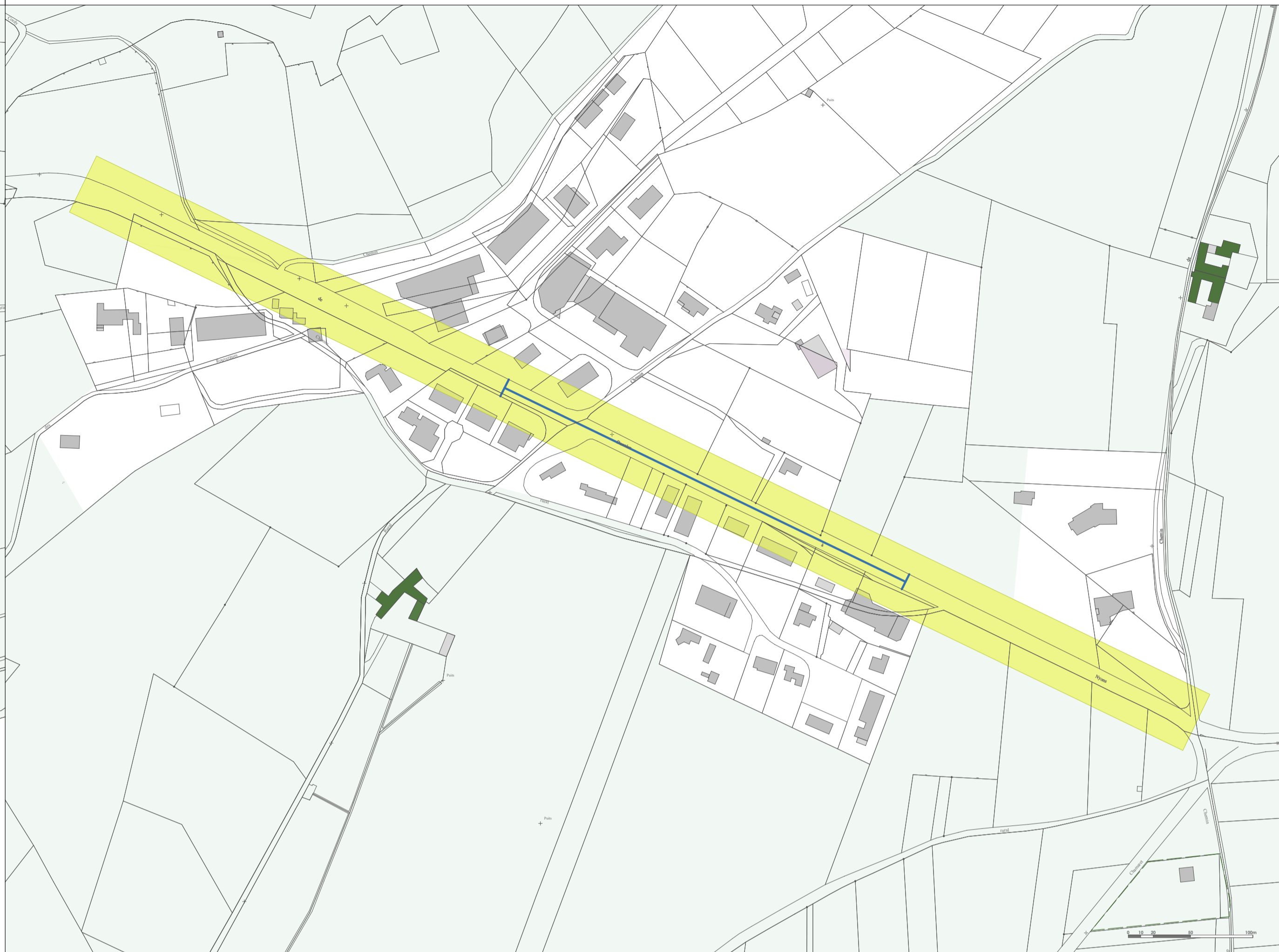
LES ABORDS DE LA ZONE D'ACTIVITÉS